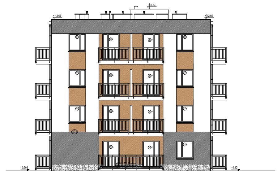
ELEWACJA BOCZNA POŁUDNIOWA