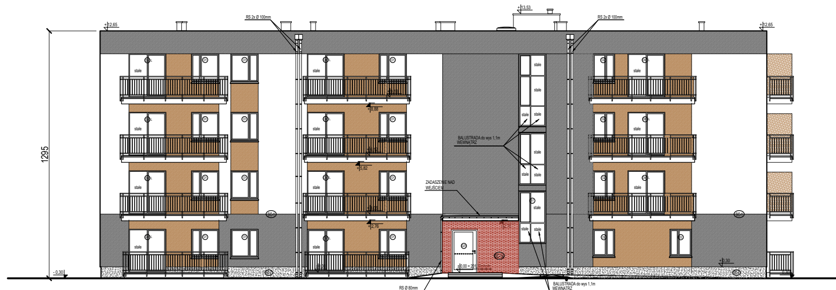
ELEWACJA FRONTOWA ZACHODNIA